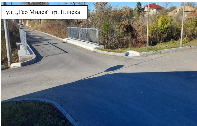
ул. „Гео Милев“ гр. Плиска