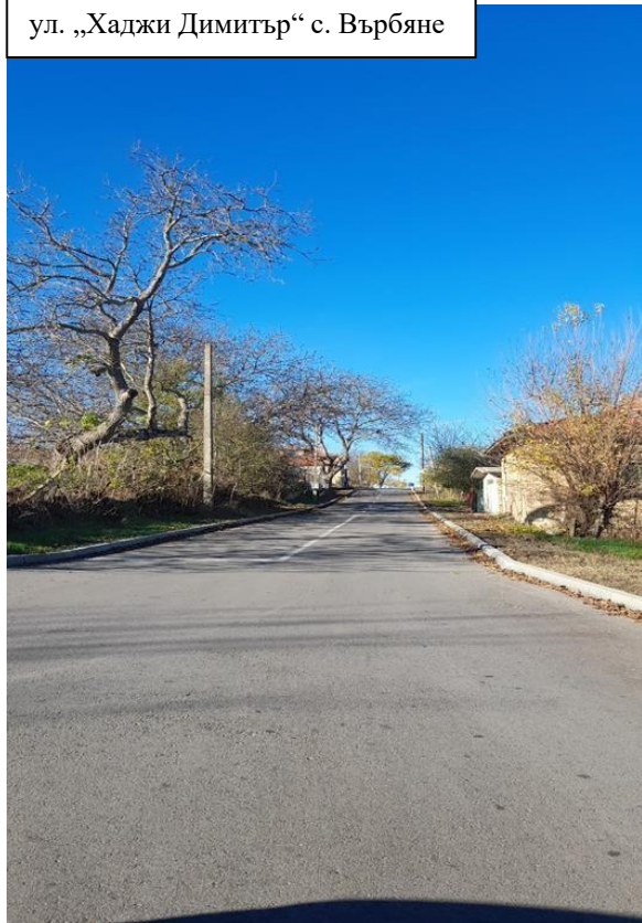
ул. „Хаджи Димитър“ с. Върбяне